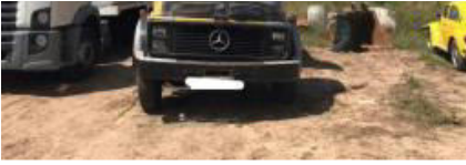
Mercedes 1316 ano 83 R$ 38.000