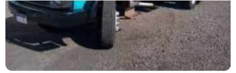
MB 1313 aprovação facilitada Parcelado R$ 40.000