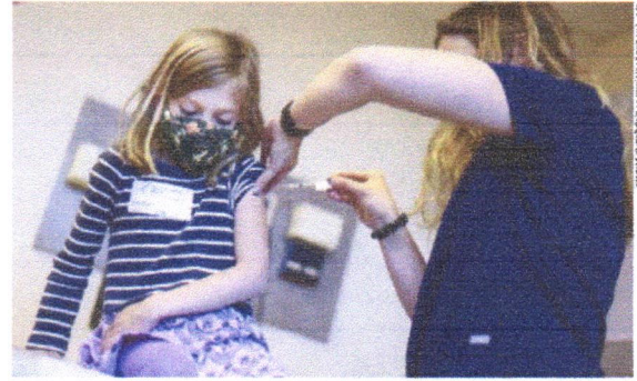
FDA Autorização da Pfizer pela agência americana FDA vai facilitar análise da Anvisa para mesma faixa etária

"Essas ameaças trazem uma dificuldade adicional totalmente desnecessária, desabida, criminosa, porque todos já trabalham no limite de suas capacidades, com enfrentamento da pandemia e o restante das suas atribuições de regular (setores que representam) praticamente um quarto do Produto Interno Bruto PIB. Isso já é muito trabalho e, na