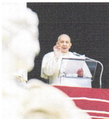
ORAÇÃO Bênção dominical vinha sendo transmitida pela internet

"Estou profundamente preocupado com os acontecimentos em algumas regiões da Ucrânia, onde nos últimos meses se multiplicaram as violações do cessar-fogo", disse ele em uma passagem de seu discurso aos fiéis.