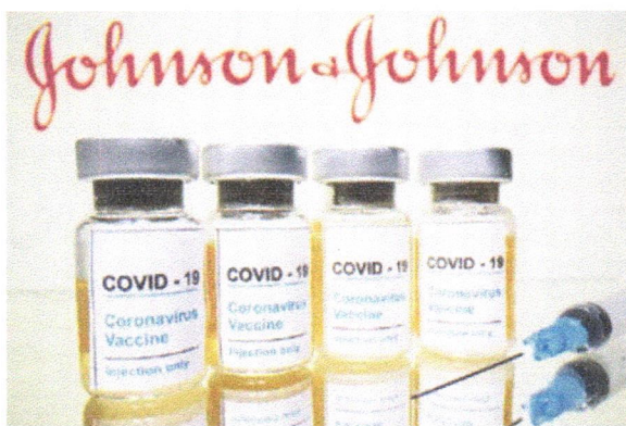
SOB ANÁLISE Suspensão há uma semana, uso do imunizante Johnson & Johnson será retomado em breve